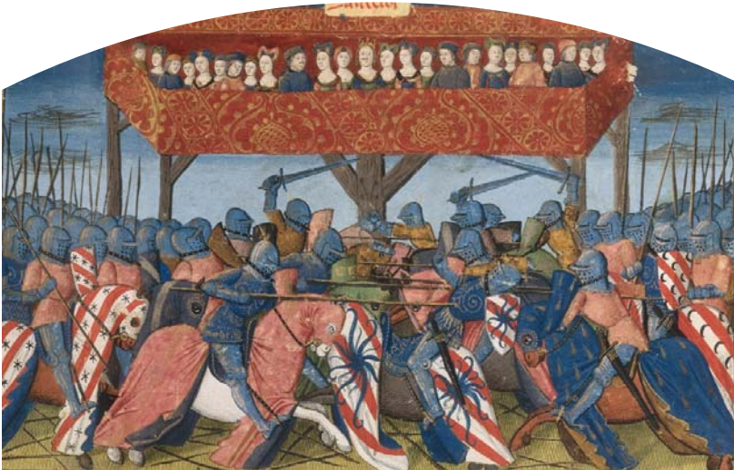
Lancelot du Lac Parchemin, France (Centre), xv e siècle (vers 1466-1470) BNF, Manuscrits, français 112-1, f. 184 r o

Le preux, celui qui sert quelqu'un, incarne au Moyen Âge cette figure laïque et aristocratique, héritée du héros antique, plus ou moins éloignée du modèle imposé par l'Église. Le personnage de Roland, chevalier éponyme de la célèbre chanson de geste qui fut écrite à la fin du xi e siècle, est l'archétype du preux qui combat au service de Dieu et de son suzerain. Mais au xii e siècle, l'idéal de la courtoisie (mode de vie des cours princières) imprègne la littérature qui s'adresse aux élites. C'est le cas des romans de Chrétien de Troyes, notamment, qui puisent dans la matière de Bretagne et mettent en scène dans un univers magique des personnages comme Lancelot qui sont courageux, beaux et généreux. Dans ce manuscrit du xv e siècle, Lancelot s'illustre sous les yeux de sa dame, la reine Guenièvre, lors d'un tournoi au cours duquel